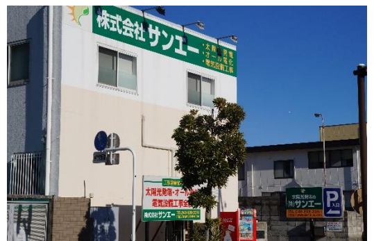
海沿いに建つ (株)サンエー本社

事業内容：次世代向け新築住宅事業 再生可能エネルギー事業 次世代 LED 照明事業 空き家の相談窓口 電気設備工事 etc.